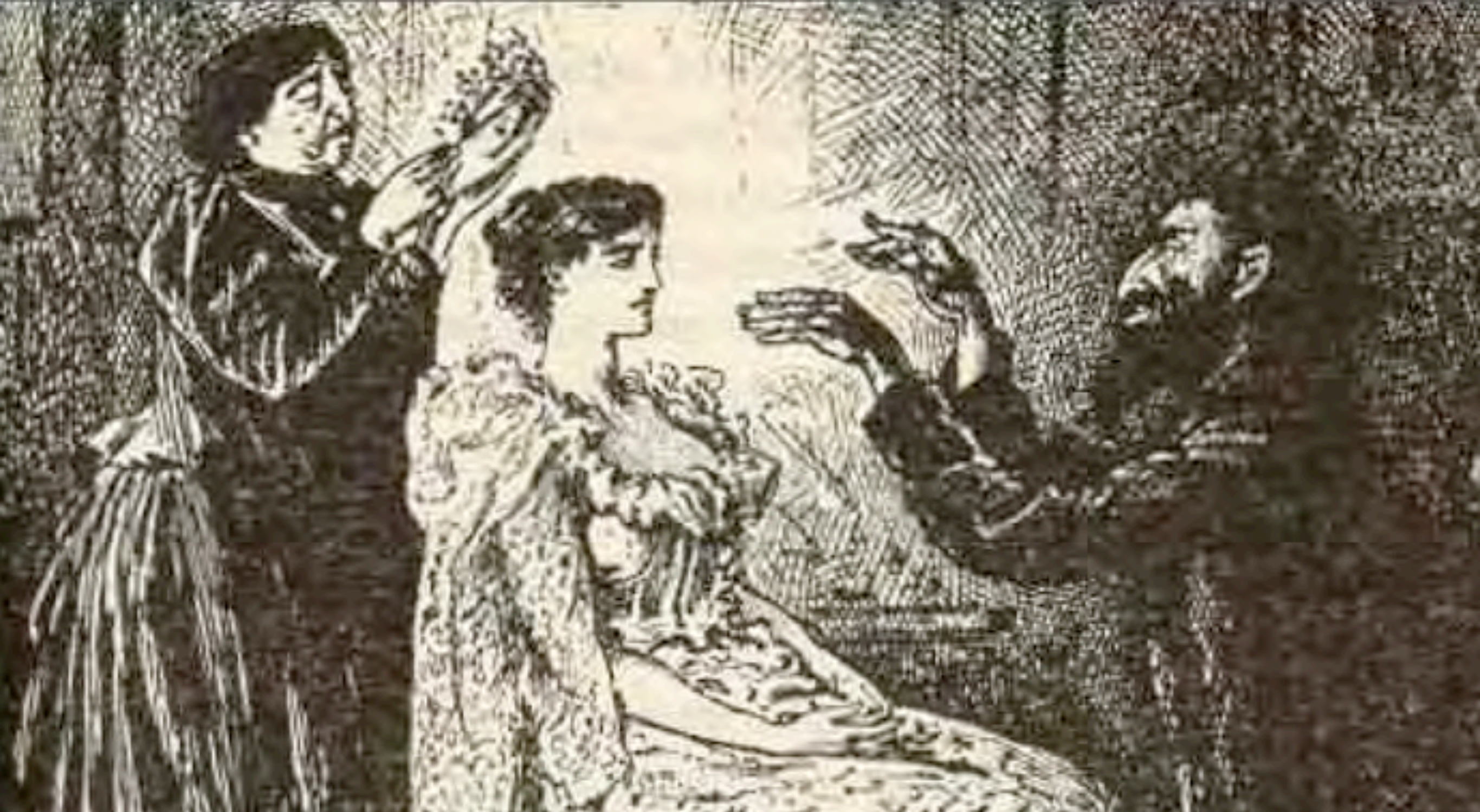
최면광선으로 희생자들을 지배하는 과학자 악당 스벤갈리 〈트리블리(Tribly)〉 (1894)